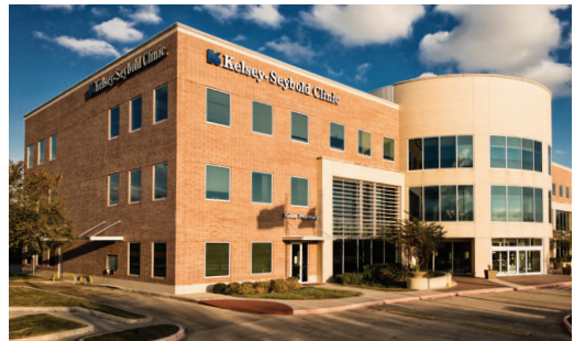
Fort Bend Medical and Diagnostic Center 11555 University Blvd. Sugar Land, Texas 77478