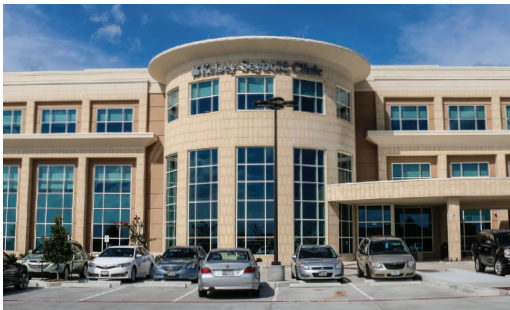
Clear Lake Clinic 1010 South Ponds Drive Webster, Texas 77598

Cuando alguien de su familia se enferma y no puede esperar hasta el lunes, Kelsey-Seybold ofrece citas los sábados de 9 a. m. a 2 p. m. en cuatro ubicaciones convenientes: Clear Lake Clinic, Fort Bend Medical and Diagnostic Center, Memorial Villages Campus y North Houston Campus.