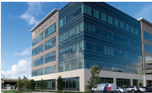
Memorial Villages Campus 1001 Campbell Road Houston, Texas 77055