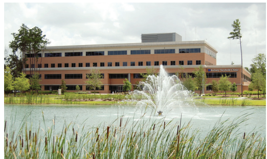
North Houston Campus 15655 Cypress Woods Medical Drive Houston, Texas 77014